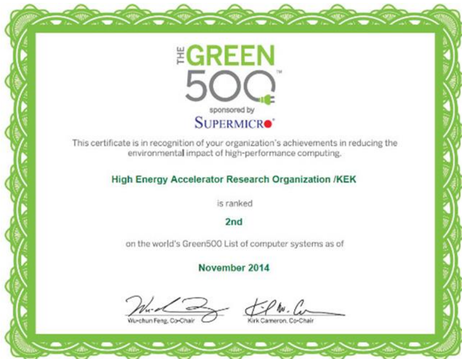
図2 Suiren（睡蓮）が設置される KEK に昨年 11 月に授与された Green500 第二位の認定書